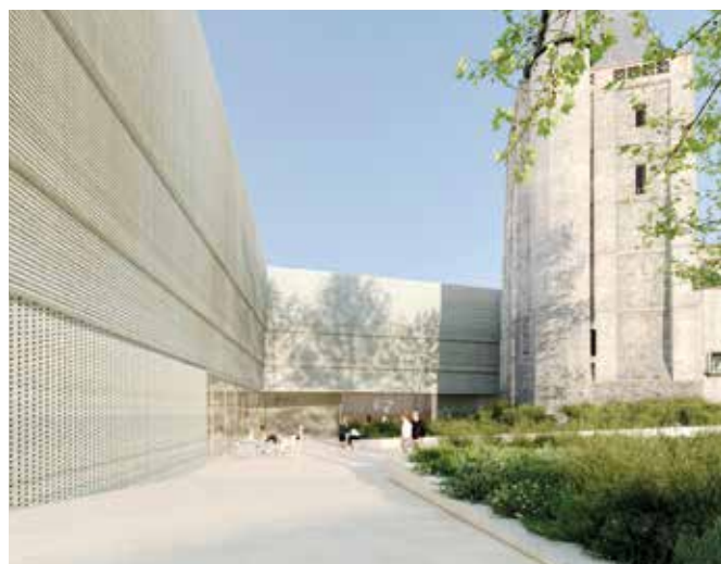
Parvis avec terrasse du salon de thé © W-Architectures.

L'édification des espaces neufs du musée et la réhabilitation des bâtiments existants auront lieu entre 2026 et 2028.