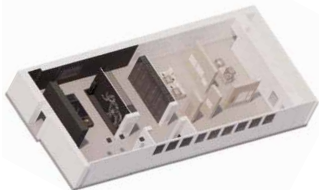
Vue axonométrique des salles de préhistoire, d'archéologie de la Picardie, et d'un univers de visite intitulé "L'esprit et la main" © Studioplano.