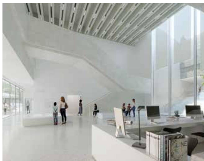
Hall d'accueil du futur musée, qui fera comptoir commun avec le bureau abbeillois de l'office de tourisme de la baie de Somme © W-Architectures.