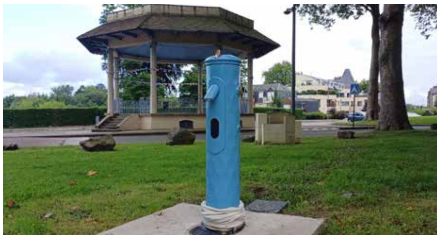
Une nouvelle borne fontaine installée à l'espace ludique de l'Argolide.