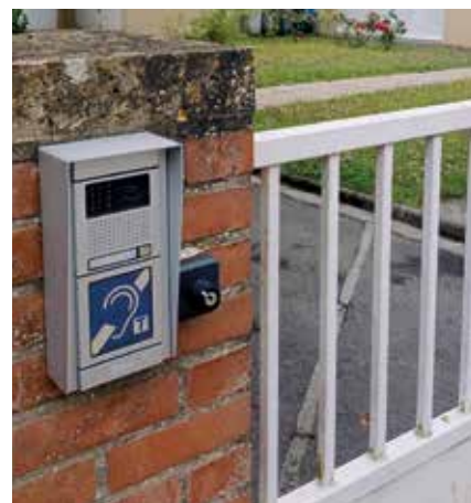
Visiophone à l'école maternelle des Platanes.