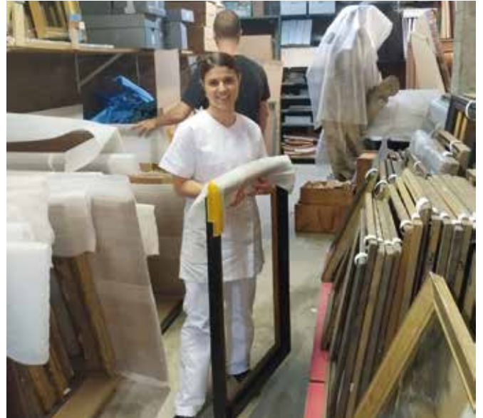
Les équipes du Pôle patrimoine en train de déménager des œuvres de la collection de préhistoire et des cadres de la collection beaux-arts.