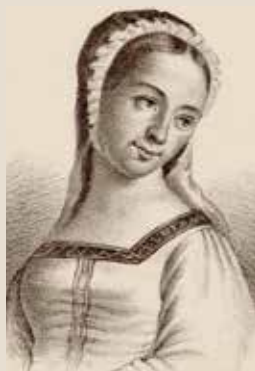
Rose BERTIN (1747-1813) Célèbre modiste de Marie-Antoinette