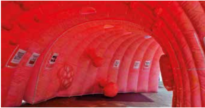
Un côlon géant gonflable pour sensibiliser la population au dépistage.

La campagne nationale d'information et de prévention du cancer colorectal sera relayée durant tout le mois par le service Santé de la Communauté d'agglomération et ses partenaires. Objectif : sensibiliser et lever les freins au dépistage organisé.