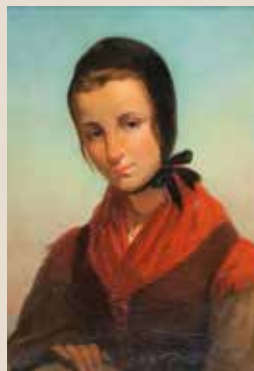
Hélienne DE CRENNE (1510-1560) Écrivaine et traductrice française