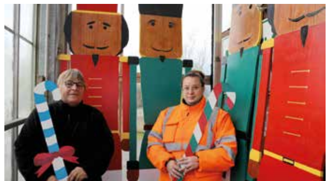
Le service Espaces verts a fabriqué des personnages Casse-noisette de plus de 2 mètres de hauteur.

+ Retrouvez toute la programmation dans la brochure "Les Fêtes de Noël", disponible dans les lieux publics, sur www.abbeville.fr , sur l'application Abbeville ou flashez ce QR code