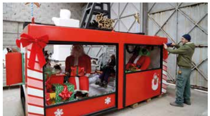
Le service Insertion a créé de toutes pièces un téléphérique et ses passagers.

Les services municipaux ont fait preuve de créativité et d'ingéniosité. Place Bonaparte, c'est un nouveau tableau qui vous attend : le Père Noël et le Grinch prennent le téléphérique ! Tandis que sur l'hôtel de ville, des personnages Casse-noisette prendront la pose place Max Lejeune.