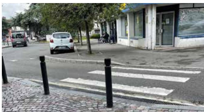
Place Bonaparte (rendre accessible le passage piéton - montant : 1 515,08 € HT).

L'équipe municipale recense également les besoins en matière d'accessibilité lors des permanences des déléguées de quartier, ou encore à l'occasion des balades urbaines. Suite à plusieurs constats, des aménagements ont été réalisés, afin d'assurer la sécurité des piétons et d'améliorer le quotidien des personnes en fauteuil mais aussi des personnes âgées en perte de mobilité, des déficients visuels, ou encore des personnes qui se déplacent avec une poussette.