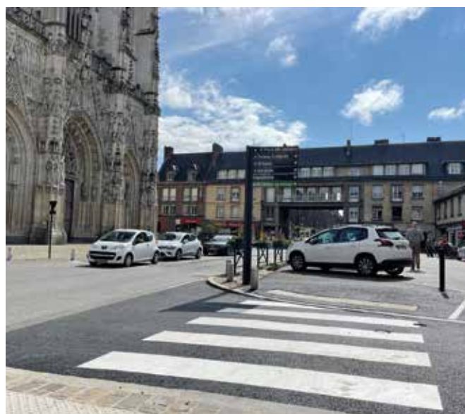
Parvis Saint-Vulfran (création d'un cheminement piéton - montant : 9 946€ HT).