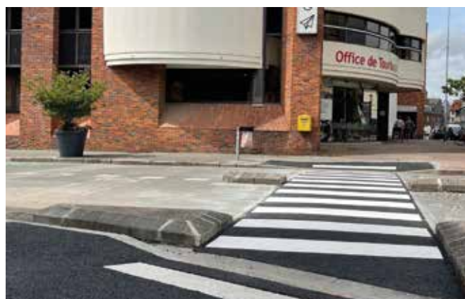
Rue Sainte Catherine (reprise de la traversée piétonne allant à l'Office de Tourisme - montant : 8 038 € HT).