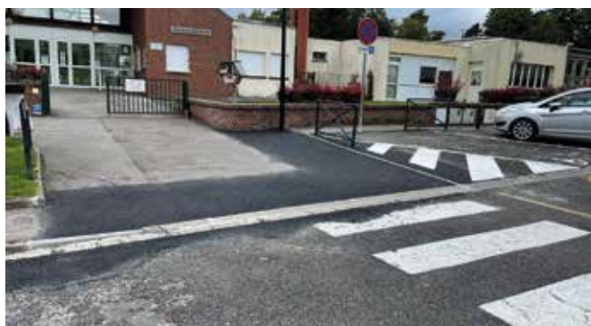
Rue Henri Sellier (mise en accessibilité du trottoir de la place PMR - montant : 2 461,50 € HT).