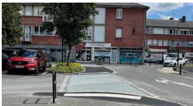
Place de la Libération (création d'un cheminement piéton sécurisé - montant : 7 658,00 € HT).