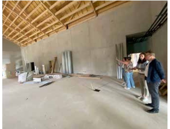
Future salle de sport.