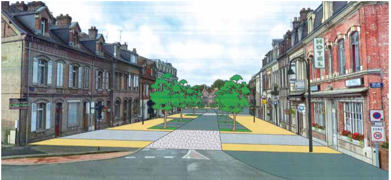
Projet de réaménagement de l'avenue de la Gare (esquisse de Yanis Vacavant).