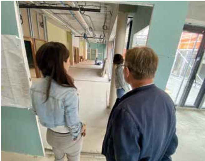
Futur bureau de l'accueil principal.

Un pôle d'activité comprenant : des salles de cours, de danse et d'expression corporelle, d'activités scientifiques, des ateliers pour les parents et leurs bébés, un studio musique, un atelier arts plastiques, un plateau radio studio d'enregistrement Télé Baie de Somme, la Maison de quartier, une salle de représentation (concert, spectacle), une cuisine collective pour ateliers avec les usagers, des salles Arts du cirque et bien-être, une terrasse végétalisée, une halle sportive avec mur d'initiation à l'escalade.