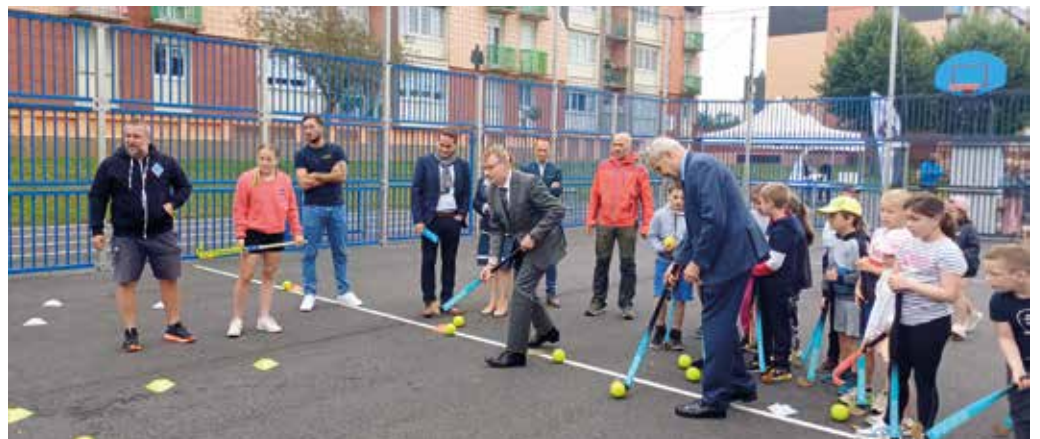
Le city stade a été inauguré le 16 juillet dernier et a accueilli des jeunes inscrits dans les activités "En route vers les JO".

La place rue des Aubépinés est désormais dotée d'un city stade et de mobilier fitness. S'en suivront l'installation d'une piste d'athlétisme et la construction d'une aire de jeux.