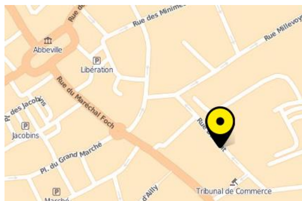
Résidence « Robert Page »