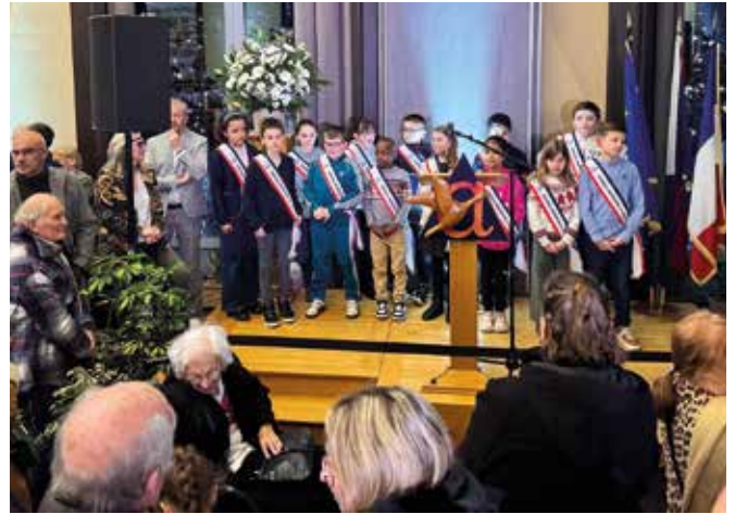
Présentation du CMJ lors de la cérémonie des vœux à la population.

Cette initiative s'inscrit dans une volonté de renforcer le lien intergénérationnel et de permettre aux jeunes d'avoir une influence sur les décisions qui les concernent. La forte présence des enfants des écoles abbevilloises lors