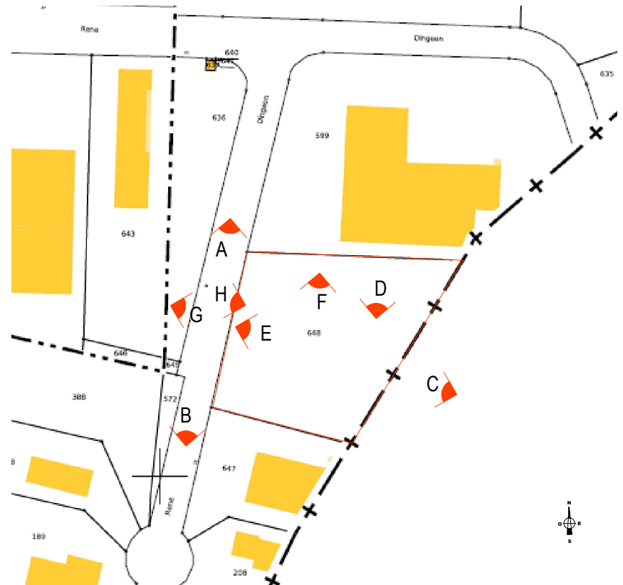
EXTRAIT DE PLAN CADASTRAL D'ABBEVILLE Parcelle 000 BN 648 (4334 m 2 )