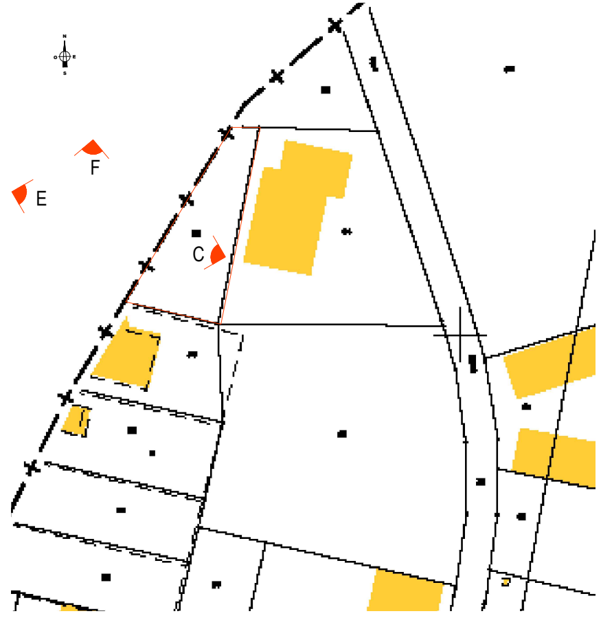
EXTRAIT DE PLAN CADASTRAL DE VAUCHELLES-LES-QUESNOY Parcelle 000 ZO 63 (1813 m 2 )